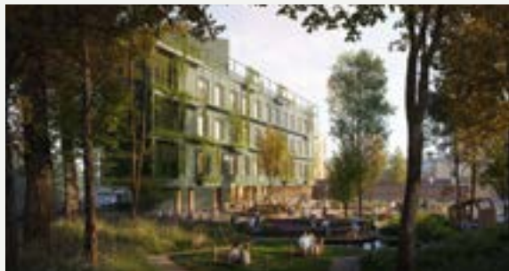
Utvidet campus for VID vitenskapelige høyskole.