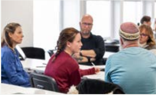
Diskusjoner i mange ulike arbeidsgrupper har vært en viktig del av fusjonsprosessen.