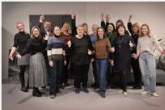
Da fusjonen var på plass ble den markert med kake på de ulike lokasjonene - her er bilde fra Lillestrøm.

– Vi måtte finne det felles verdigrunnlaget etter fusjonen og samtidig forankre det i eiernes diakonale og ideelle tradisjoner. Gjennom verdiseminar og strategiarbeid med styret, ledergruppen og alle ansatte, har vi tydeliggjort hvem vi er som én felles fagskole. Prosessen har gjort oss mer bevisste på at vi kanskje ikke var så forskjellige som vi egentlig trodde.