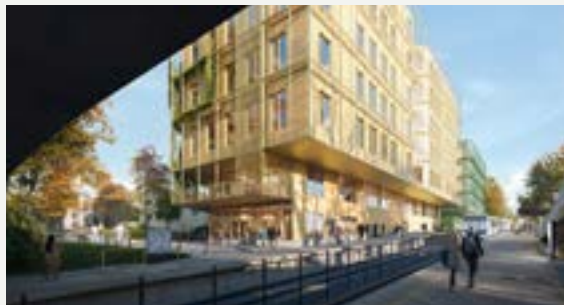
Nye Diakonhjemmet T-banestasjon.