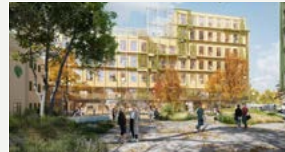
Ny videregående skole for 810 elever.