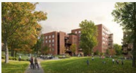
Nytt sykehjem med 138 langtidsplasser.

FOR 12 ÅR siden besluttet Diakonhjemmet å intensivere vårt bidrag for å møte fremtidens samfunnsutfordringer.